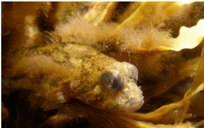
Kivisimppu ( Cottus gobio ) rakkolevä metsässä. (Valokuvaesityksen kuvanumero 29.)

26. Näkinpartaislevä.