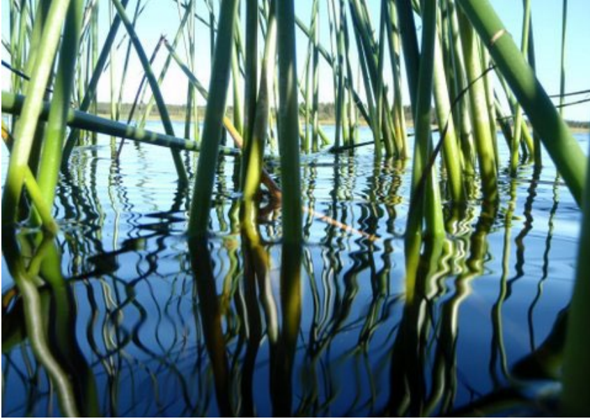
Kaislikko Perämeren pohjukassa. (Valokuvaesityksen kuvanumero 2.)