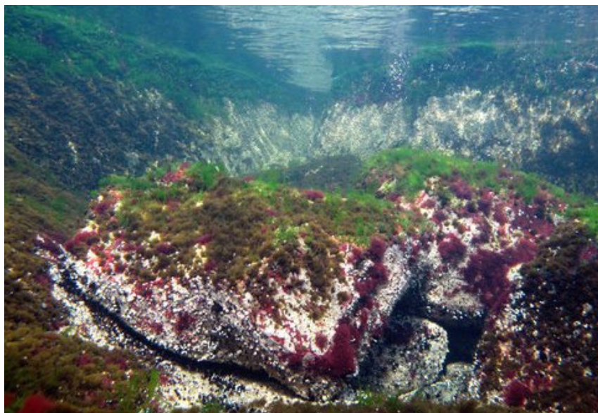
Vedenalainen maisema. (Valokuvaesityksen kuvanumero 53.)