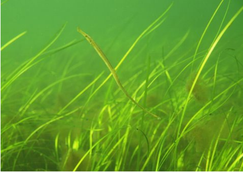
Särämäneula ( Syngnathus typhle ) meriajokasniityllä. (Valokuvaesityksen kuvanumero 38.)