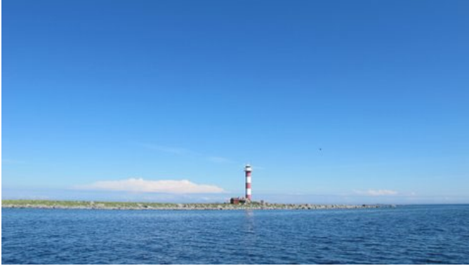
Majakka Merenkurkussa.