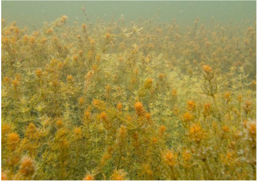
Punanäkinpartaniitty. (Valokuvaesityksen kuvanumero 84.)