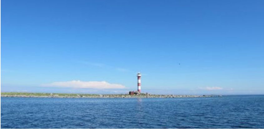
Majakka Merenkurkussa. (Valokuvaesityksen kuvanumero 21.)